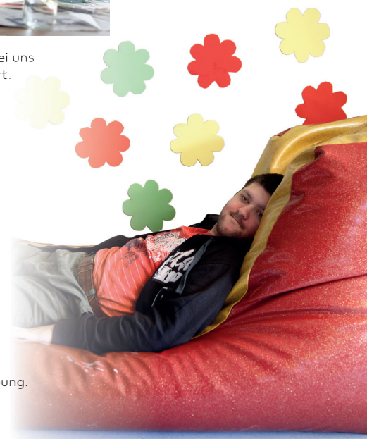
Wohnen in vertrauter Umgebung.