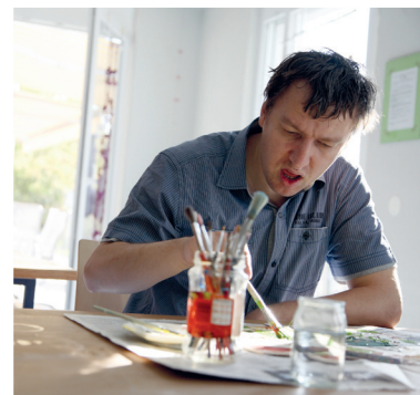
Kreativität wird bei uns ebenfalls gefördert.

Durch intensiven Kontakt zu Angehörigen, Ehrenamtlichen, Vereinen und der Gemeinde fördern wir gezielt Begegnung und Teilhabe.