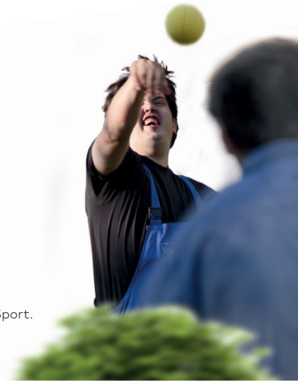
Spaß bei gemeinsamem Sport.