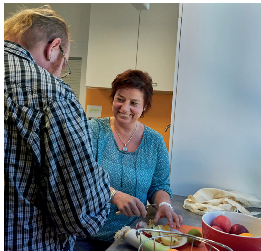
Gemeinsam mit Ihnen entwickeln wir eine gesundheitsfördernde Lebensweise.

Neben praktischer Begleitung im Alltag gehört es zu unseren Aufgaben, gemeinsam Probleme zu lösen und Lebensfreude zu entdecken und zu vermitteln.