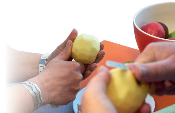
Praktische Hilfen im Alltag.