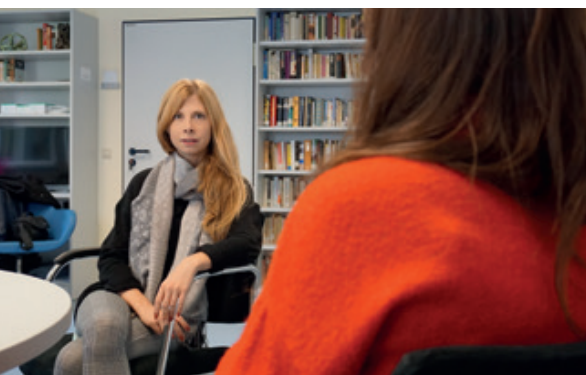
Zu den Bausteinen einer Therapie in der Tagesklinik gehört unter anderem Gesprächstherapie...

Die Betreuung in der Tagesklinik leistet ein Team aus Mitarbeiterinnen und Mitarbeitern verschiedenster Berufsgruppen: ärztliches und psychotherapeutisches Personal, Pflege, Sozialarbeit, Ergotherapie sowie Verwaltung.