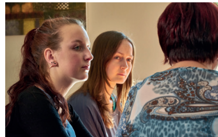
Der Austausch in Therapiegruppen ergänzt die Einzeltherapie und kann zu neuen Perspektiven verhelfen.