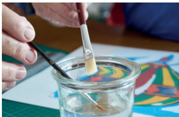
...und die Möglichkeit, in der Ergotherapie einen kreativen Ausdruck Ihrer persönlichen Situation zu finden.

An erster Stelle steht für uns ausführliche Beratung und Information über Ihre Erkrankung sowie über die vielfältigen Therapiemöglichkeiten, die zu gesundheitsfördernden Erfahrungen verhelfen. So entsteht ein individueller Behandlungsplan. Auch Angehörige beziehen wir auf Wunsch in die Therapie ein. Wir unterstützen Sie bei der Orientierung in Ihrer derzeitigen Lebenssituation und bieten Hilfestellungen in sozialer, finanzieller und beruflicher Hinsicht.