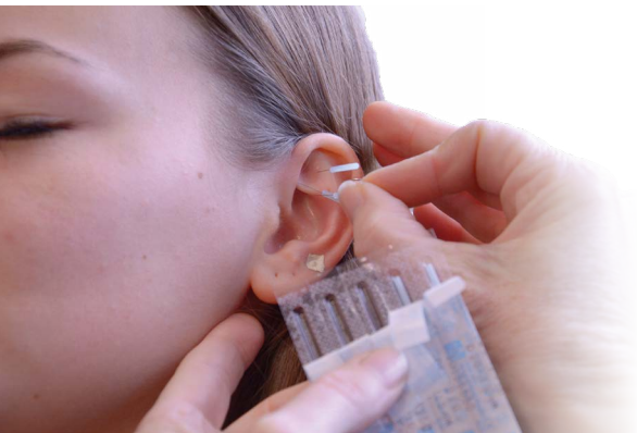
Um Entzugserscheinungen zu lindern, kommt auch Akupunktur zum Einsatz.

Ihre individuellen Behandlungsziele planen Sie gemeinsam mit uns. Wir lindern Ihre Entzugserscheinungen möglichst ohne Medikamente, hierbei kommen unter anderem Akupunktur, Achtsamkeitstraining, Aromatherapie und Entspannungsbäder zum Einsatz. Die Behandlungsdauer hängt von Ihrer persönlichen Situation ab und beträgt in der Regel ca. drei Wochen. Nach Rücksprache ist eine ambulante, tagesklinische Behandlung (ITK) möglich. Ebenso begleiten wir Sie nach Wunsch in unserer Suchtambulanz (SIA). Auch eine gemeinsame Entzugsbehandlung mit Ihrer Partnerin oder Ihrem Partner sowie mit Kind bis zum 6. Lebensjahr ist bei uns möglich.