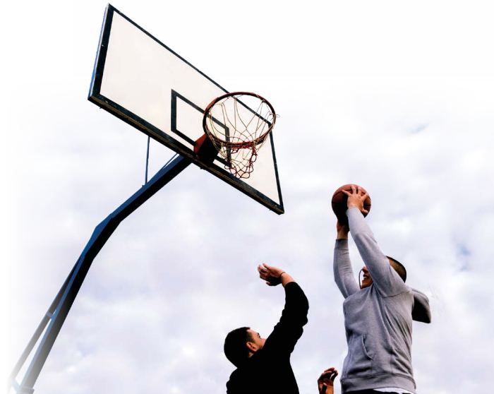
Sporttherapie unterstützt Sie auf dem Weg der Entgiftung.