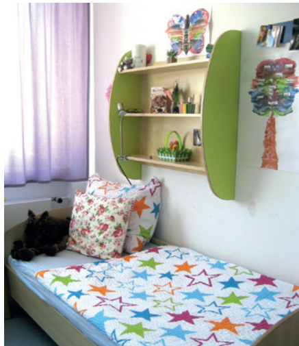
Ein Zimmer in der Jugendklinik in Klingenstein.

In der Regel findet vor der Aufnahme ein Klärungsgespräch mit den Sorgeberechtigten und ihrem Kind bzw. Jugendlichen statt. Gemeinsam werden die nächsten Behandlungsschritte erörtert. Während des Aufenthalts besuchen die Kinder und Jugendlichen den Krankenhausunterricht.