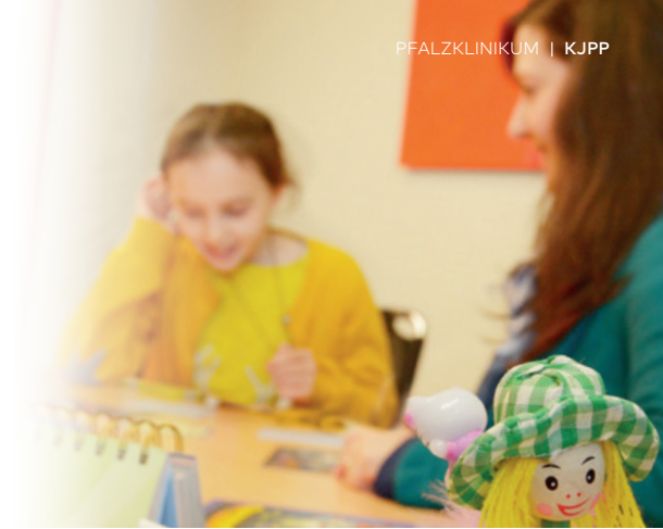
Einzelgespräche und Gruppenangebote, Schule und Freizeitgestaltung: Die Angebote sind vielfältig.