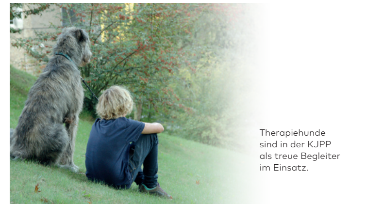
Therapiehunde sind in der KJPP als treue Begleiter im Einsatz.

Nach Zustimmung durch die Sorgeberechtigten suchen wir den engen Kontakt zu Schulen, Jugendämtern, Institutionen, Einrichtungen der Jugendhilfe sowie weiteren Helferinnen und Helfern vor Ort.