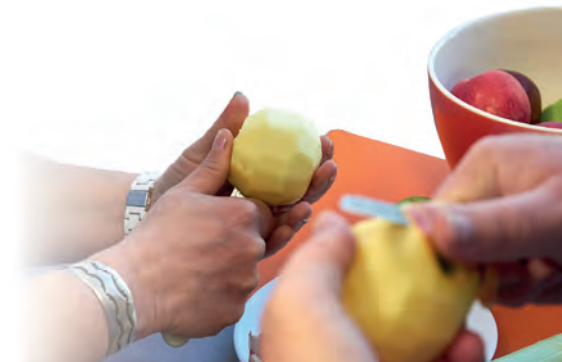
Praktische Hilfen im Alltag.