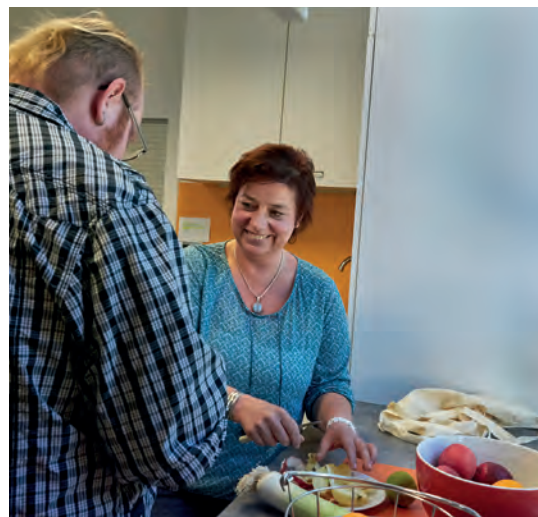
Gemeinsam mit Ihnen entwickeln wir eine gesundheitsfördernde Lebensweise.

Neben praktischer Begleitung im Alltag gehört es zu unseren Aufgaben, gemeinsam Probleme zu lösen und Lebensfreude zu entdecken und zu vermitteln.