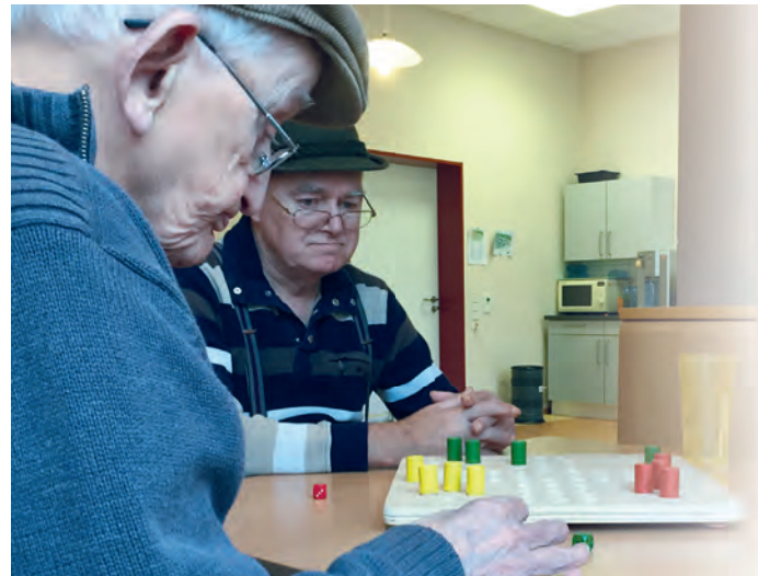
Gesellschaftsspiele in der Freizeit.

Gemeinsam können Sie Ihre individuellen Fähigkeiten stärken und neue Ressourcen entdecken.