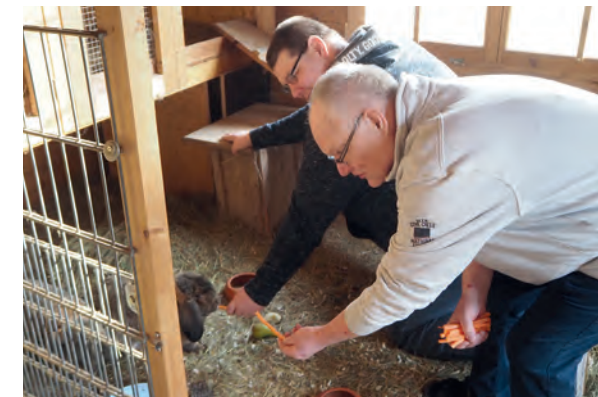
Umsorgt von Bewohnern: unsere Hasen.

Unsere Ausstattung macht es möglich, dass wir alle pflegerischen Maßnahmen bei Bedarf umsetzen können.