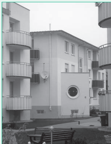
Die Tagesklinik – mitten im Wohngebiet

Für Sie und Ihre Angehörigen besteht auch die Möglichkeit, zu unserem „offenen Freitagnachmittag“ von 14.30 Uhr bis 16.00 Uhr zu uns zu kommen und uns kennenzulernen.