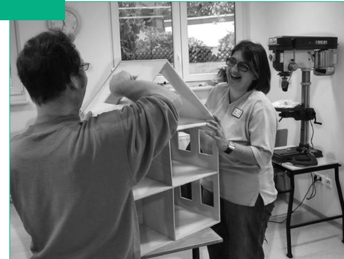
Helle Werkstatt für die ergotherapeutische Arbeit

Auf Ihren Wunsch finden gemeinsame Gespräche mit Ihren Angehörigen statt.