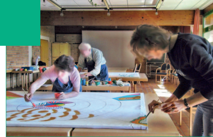
Gemeinsam großflächig malen