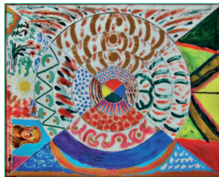
Aus der Ergotherapie

Eine teilstationäre Behandlung im offenen Bereich ist nach Gesprächen in unserer Ambulanz möglich. In der Regel geht eine stationäre Behandlung voraus.