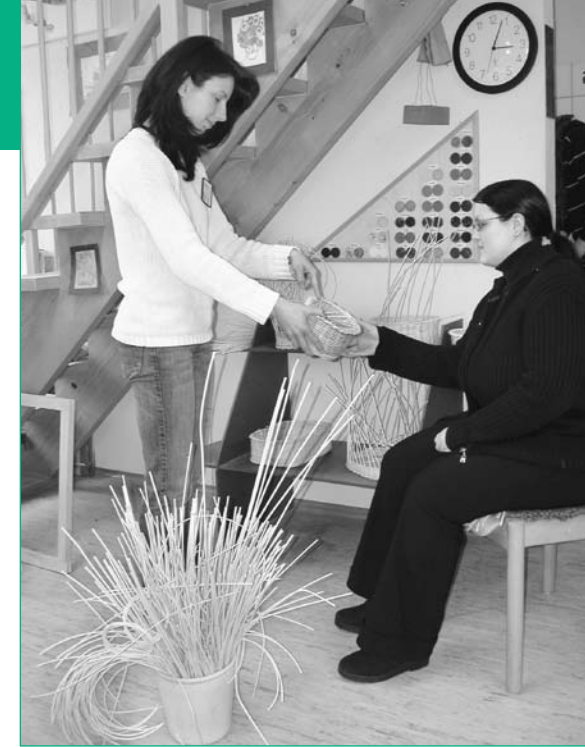
In der Ergotherapie