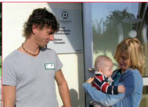
Kinder bis zum Vorschulalter können auf „Cleaneck“ betreut werden.