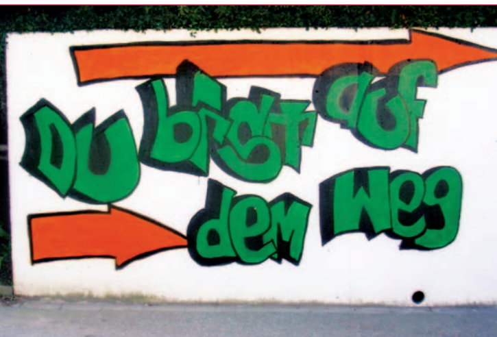
Ergebnis eines Graffiti-Workshops

Ihr Behandlungsteam der Station „Cleaneck“