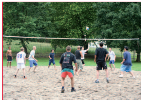
Sport gehört auf „Cleaneck“ fest zum Behandlungsprogramm