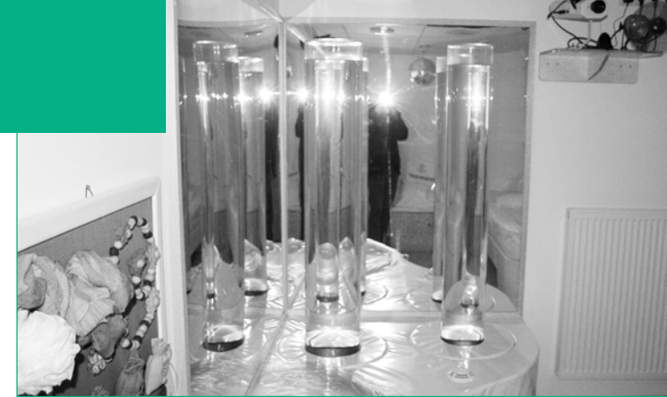
Wassersäulen im Snoezelenraum

Wir möchten verstehen, welche Gefühle, welche Ereignisse das Leben der bei uns lebenden Menschen geprägt haben, welche Beziehungen es gab, welche Freuden und Belastungen auf welche Art und Weise gewirkt haben. Wir interessieren uns für die Lebensgeschichte der Bewohnerinnen und Bewohner, um diese in der Begleitung berücksichtigen zu können.