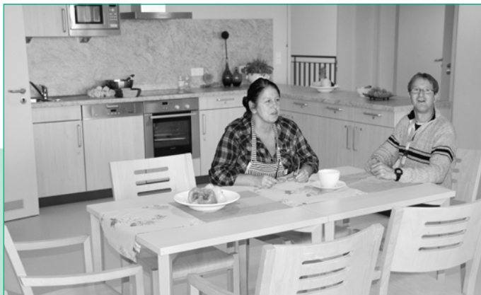
In der Wohnküche

Die Wohnstätte Maikammer bietet eine Begleitung rund um die Uhr für die dort lebenden Menschen an.