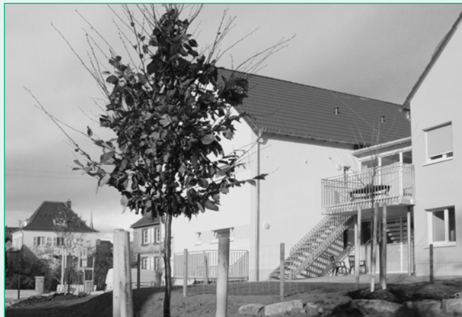
Giebelansicht von der Weinstraße

Ein Einzelzimmer ist für die Kurzzeitpflege reserviert.