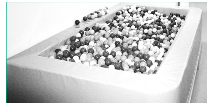
Das Bällchenbad kann verschiedene Sinne ansprechen.

Die Kosten werden in der Regel von den Sozialhilfeträgern übernommen.