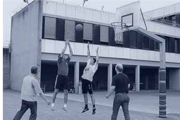
Sport- und Bewegungstherapie,