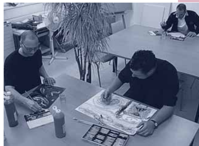
Kunst- und Musiktherapie sind weitere Bestandteile der Behandlung.