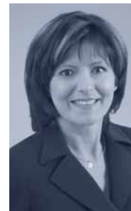
Malu Dreyer Ministerin für Arbeit, Soziales, Gesundheit, Familie und Frauen Rheinland-Pfalz