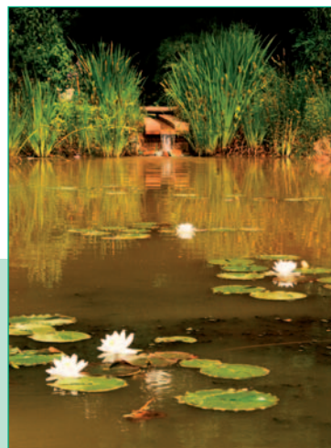
Im Garten der Klinik Kaiserslautern: Teich mit Seerosen