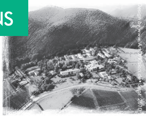
Design by www.ArtOfMission.de • Sept. 2010