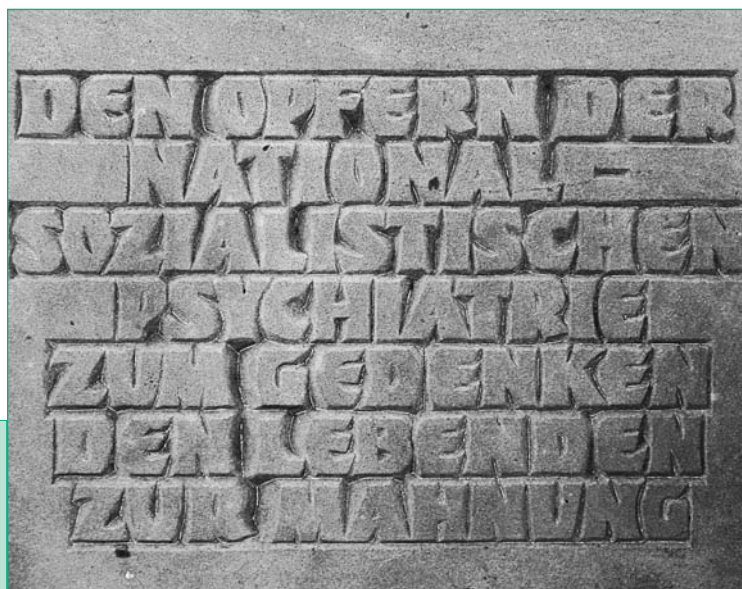
Gedenkstein an der Klinikallee

Nun sollen Stelen mit Informationen und weitere Gestaltungselemente in die Grünflächen integriert werden. Inhaltliche und gestalterische Fragen werden mit interessierten Menschen diskutiert, die herzlich zur Mitarbeit eingeladen sind.